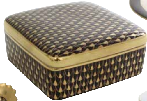
Cigarettdoboz, fedeles / 07888000 VHN-OR