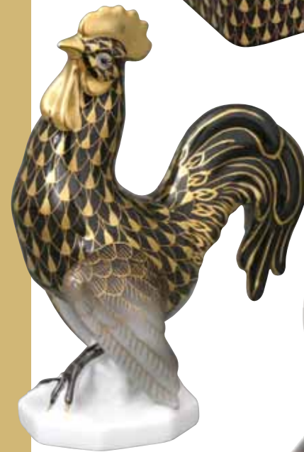
Kakas 15014000 VHN-OR