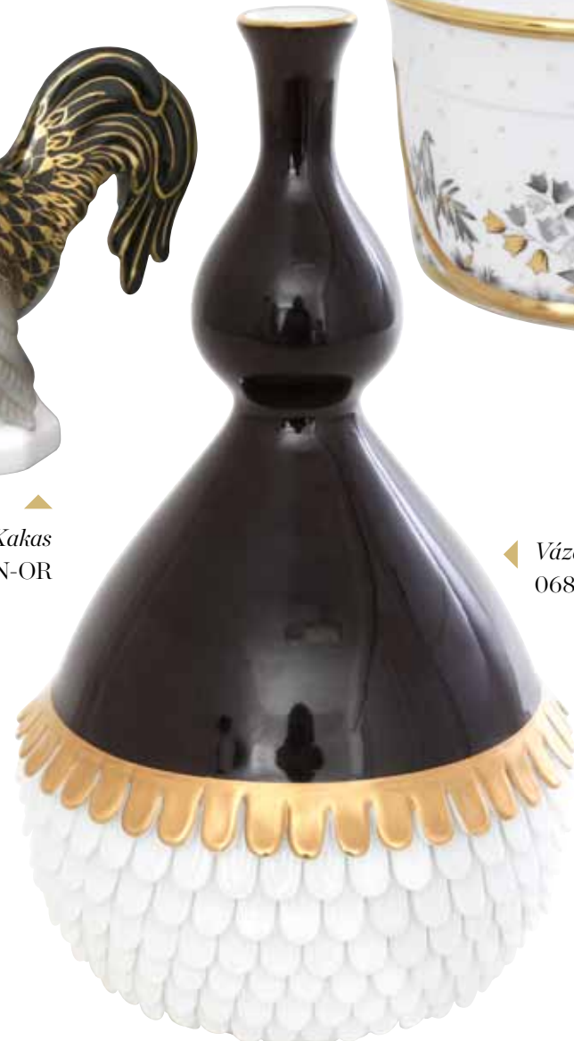
Váza, alul pikkelyekkel / 06863000 COUBARD3